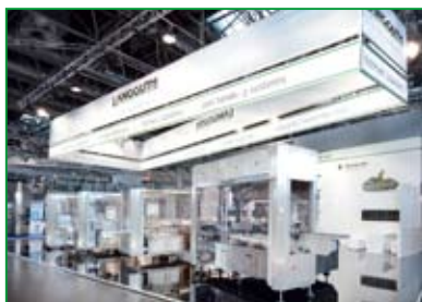
Eine der erfolgreichsten INTERPACK Messen – auch für LANGGUTH. One of the most successful INTERPACK fairs – also for LANGGUTH.